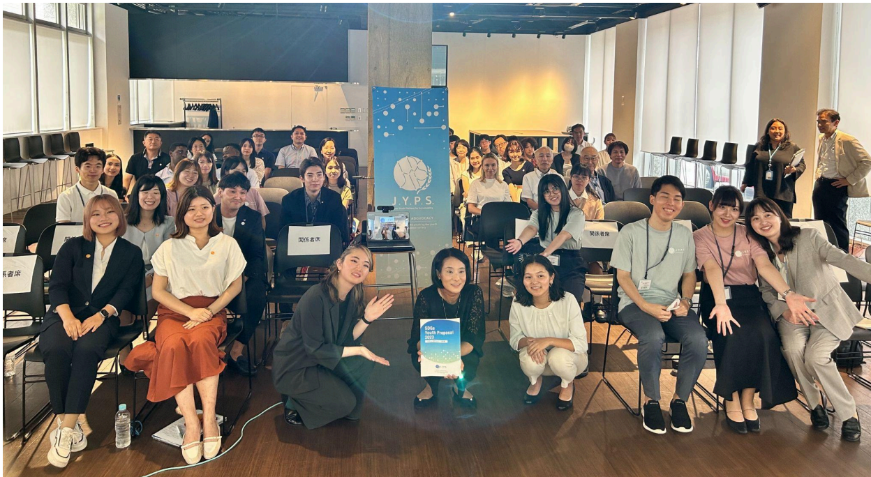
イベント当日の写真

本イベントでは、「ユースの政策立案プロセスへの意味のある参画」を推進するため、2023年9月に開催されるSDG SummitやCOP28、そして2024年のThe Summit of the Futureなど、SDGsの達成に向けて重要なマイルストーンとなる国際会議に対してのインプットを行うとともに、この目標達成に向けたJYPSとUNU-IAS、その他のステークホルダーとの連携の方向性について議論を行いました。