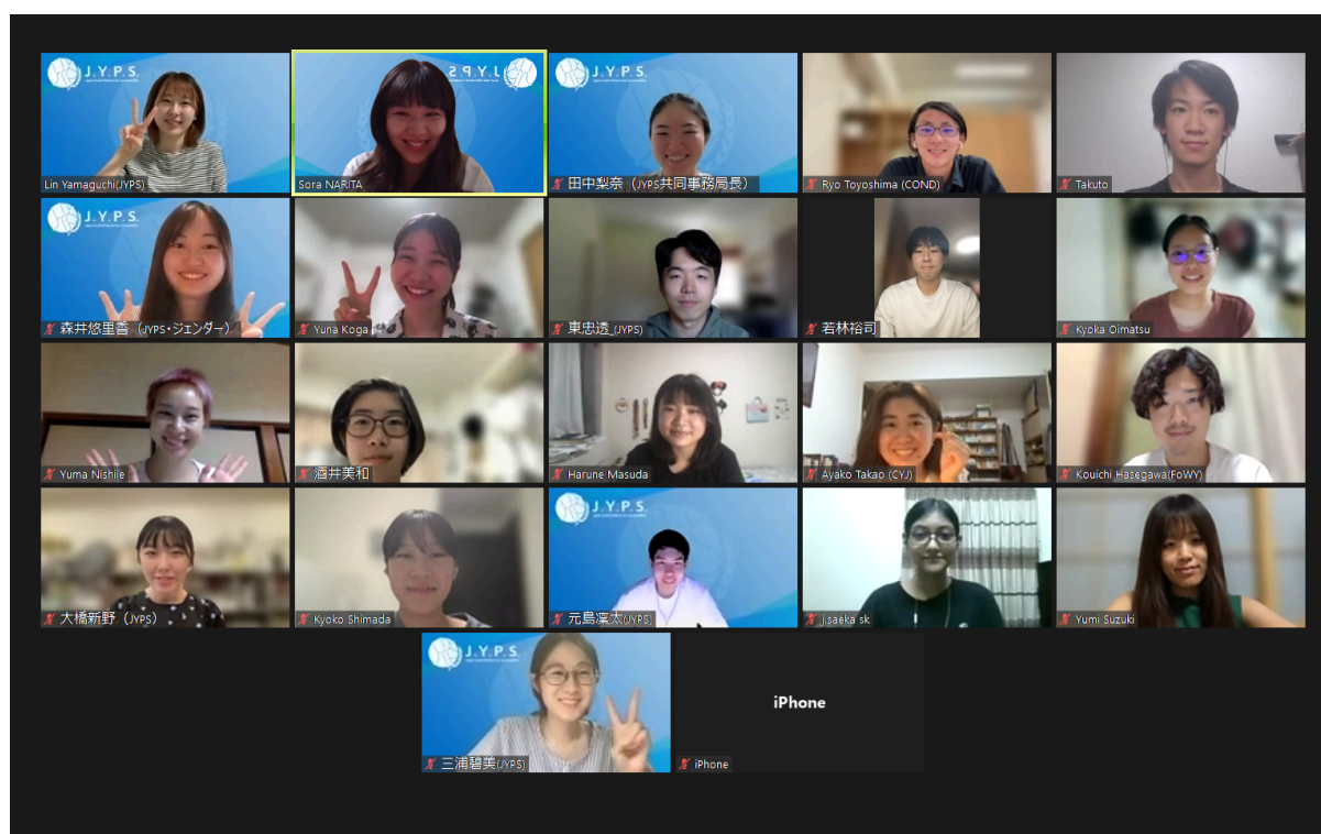
ユース代表による基調講演と 「People Planetの分野の現状とユース参画について」のディスカッション