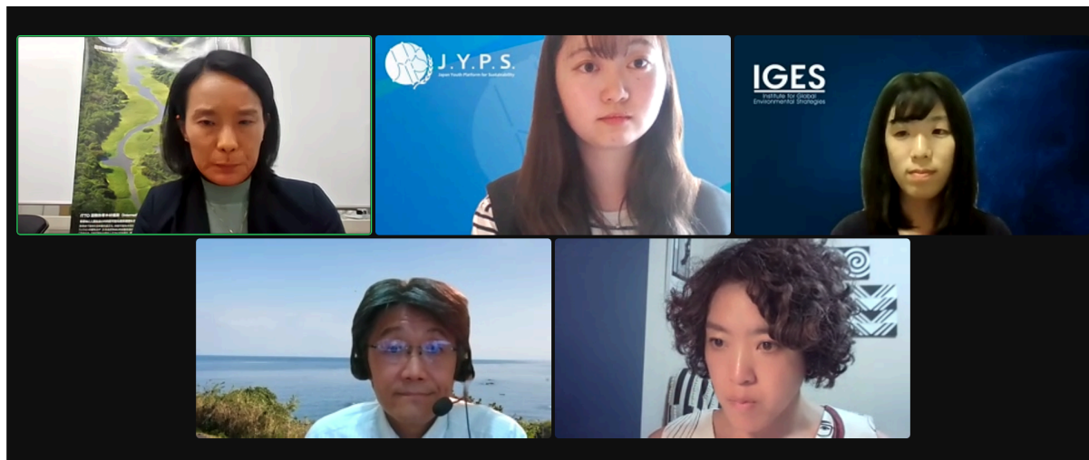
ビジネス、行政、市民社会、アカデミアの4セクターからの登壇者による基調講演と パネルディスカッション