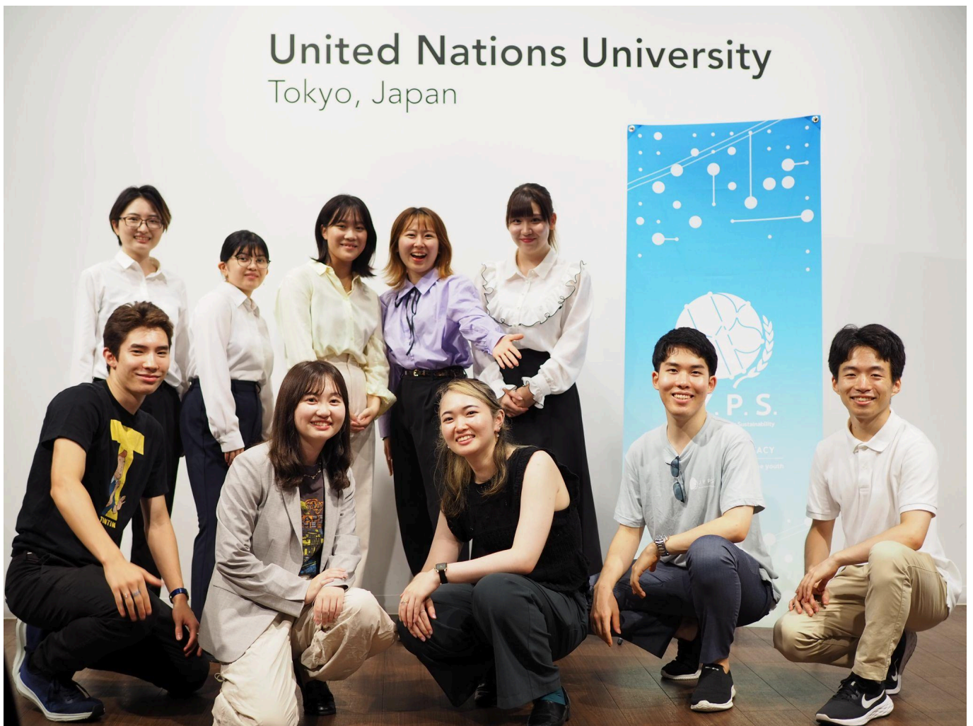
SDG Youth Summit 2023 に現地参加した事務局員の集合写真