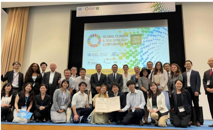
シナジー会議 提言書手交