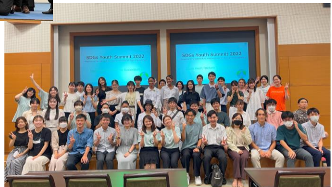
Youth Summit 2022